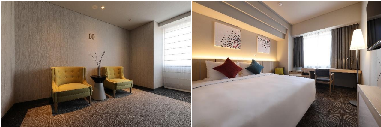
スタンダードキングルーム