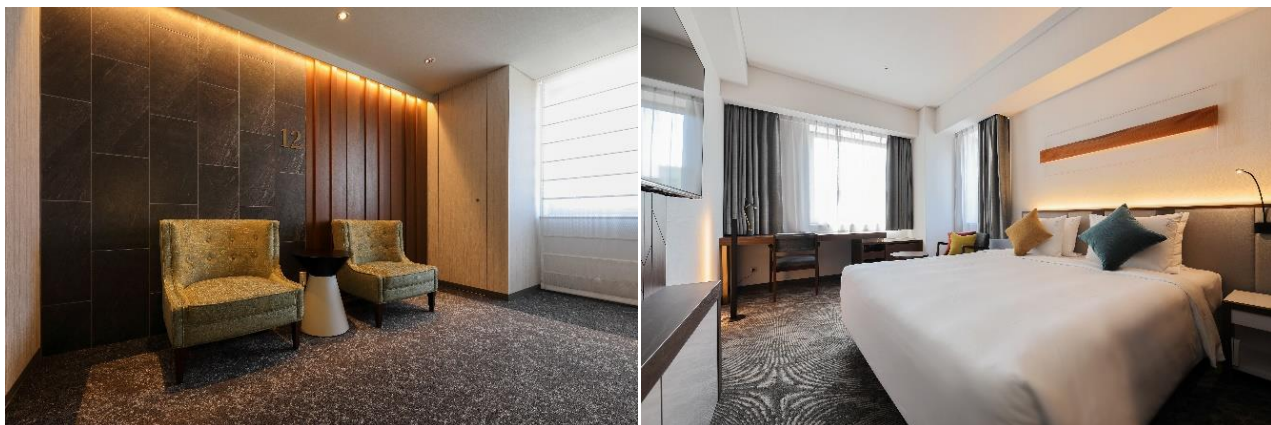
プレミアムキングルーム