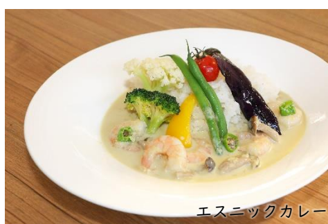
エスニックカレー