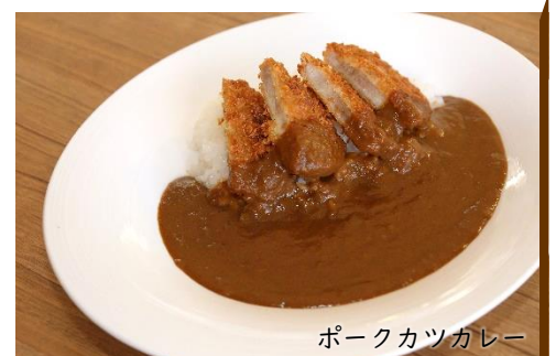
ポークカツカレー