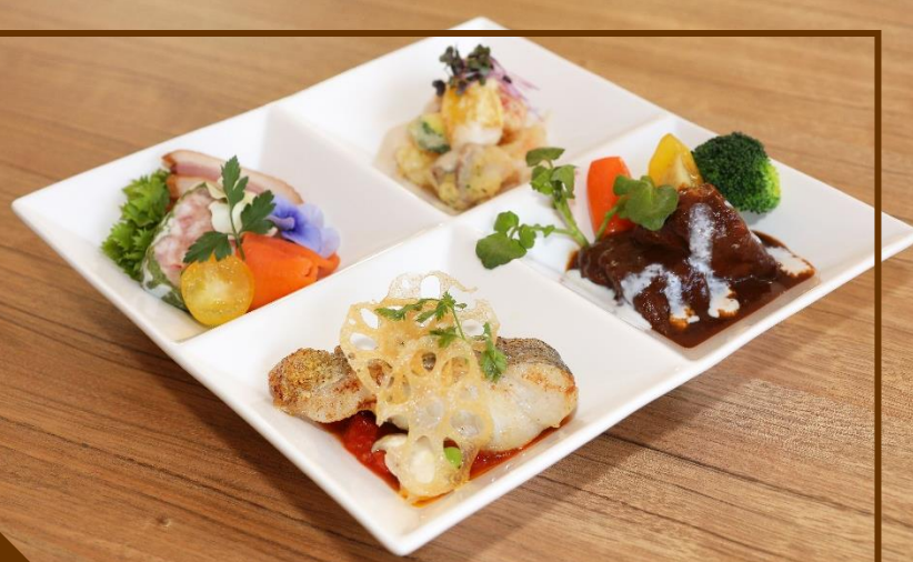
リュクスプレートランチ

当レストランのランチメニューには ミールバー（サラダ・スープ・特製中華粥 ドリンクバー）の金額が含まれております